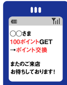
タッチポイント画面